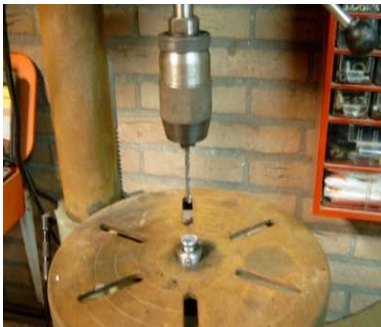
Gat boren 4,8 mm