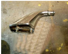
Eindstuk met nieuwe O-ringen

Eindstukken voorzien van nieuwe O-ringen en op de r.v.s. buis monteren en klaar zijn je dakrails.