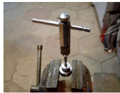
Draad tappen M6