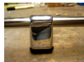
Van twee korte dakrails, is nu één lange dakrail gemaakt.