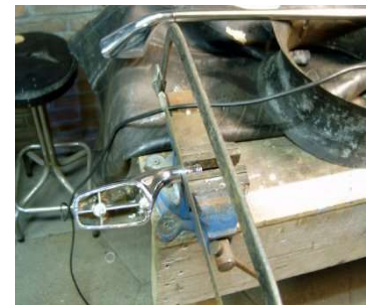
Nokken van de eindstukken zagen