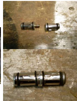
Nokken aan elkaar verbinden