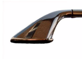
Eindstuk gemonteerd aan r.v.s. buis