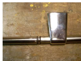
R.v.s. buizen verbinden d.m.v. nokken