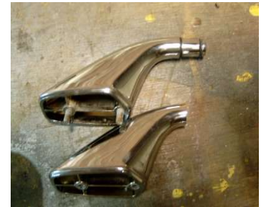
Één nok reeds afgezaagd

Nu gaan we de middensteunen m.b.v. een blokje hout en een hamer voorzichtig van de r.v.s. buis afslaan, dit vergt enige kracht omdat de middensteun is verlijmt aan de r.v.s. buis.