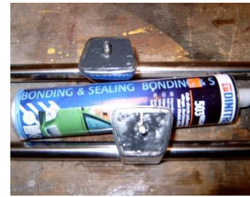
Middensteun dicht kitten en rubber afdichting aanbrengen

Daarna gaan we de middensteun vol spuiten met raamkit, dit ter voorkoming dat de middensteun vol kan lopen met regenwater. Wat wel het geval was op de Renault, omdat de rubber afdichting werd aangetast, door het regenwater en helemaal was verteerd, ontstond er lekkage in de auto. Van een binnenband een nieuwe afdichtrubber maken, deze heb ik op de nog verse raamkit geplakt, nu vierentwintig uur laten drogen.