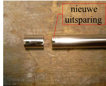
R.v.s buizen inkorten

Daarna in de afgezaagde nokken een gat boren (4,8 mm), en M6 schroefdraad tappen. Nu neem je twee tapeinden uit een afgezaagd eindstuk en hiermee bevestig je de vier nokken twee aan twee aan elkaar. Met de verkregen nokken monteer je straks de r.v.s. buizen aan elkaar.