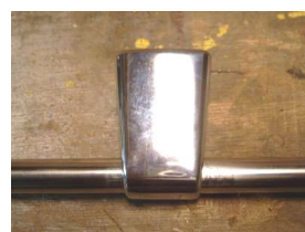
Middensteun er over schuiven (lijmen)