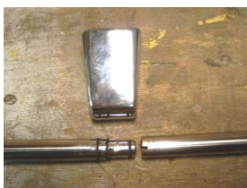
Nokken in r.v.s. buis plaatsen

Daarna gaan we de twee ingekorte r.v.s. buizen, m.b.v. de gemaakte nokken aan elkaar verbinden en schuiven de middensteun over de verbindingsnaad.. Ik heb deze verbinding vol laten lopen met secondenlijm.